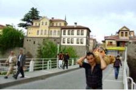
Ortahisar Mahallesi / Trabzon

Sabah Trabzon'a varı nız sonrası havaalanı ve otoparkta rehberimiz tarafından kar ılanıyorsunuz. Otele yerle tikten sonra saat 13.00'de ehir turu için ayrılıyor, ö le yeme i için Akçaabat'a hareket ediyoruz. Yemekten sonra en erken Rönesans Fresklerini barındırdı ı söylenen 13.yy Bizans kilisesi Ayasofya Müzesi ziyaretiyle Trabzon'daki ehir turumuza ba lıyoruz. Ardından Trabzonspor Bulvarı ve Avni Aker Stadyumu'nu görüyor ve Atatürk Kö kü'ne harekete ediyoruz. 20. yüzyıl ba nda in a edilen kö k Trabzon sivil mimarisinin en güzel örneklerindedir. Kö k ziyareti sonrası Trabzon'un panoramik manzarasını görebilece iniz Boztepe'ye hareket ediyoruz. Yol üzerinde üzerinde Trabzon Kalesi ve Kanuni Sultan Suleyman'ın do du u evin de bulundu u Ortahisar Mahallesi'ni ziyaret ediyoruz. Ku bakı ı ehrin manzarasının görülece i Boztepe ziyareti sonrası otelimize dönüyoruz be bugünkü gezimiz sona eriyor. Ak am yeme i otelimizde